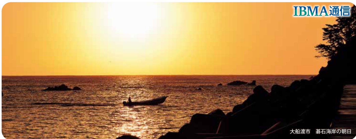
大船渡市 基石海岸の朝日