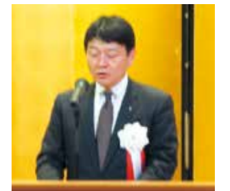
八重樫岩手県副知事祝辞