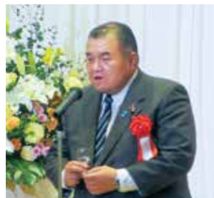
軽石県議乾杯の御発声