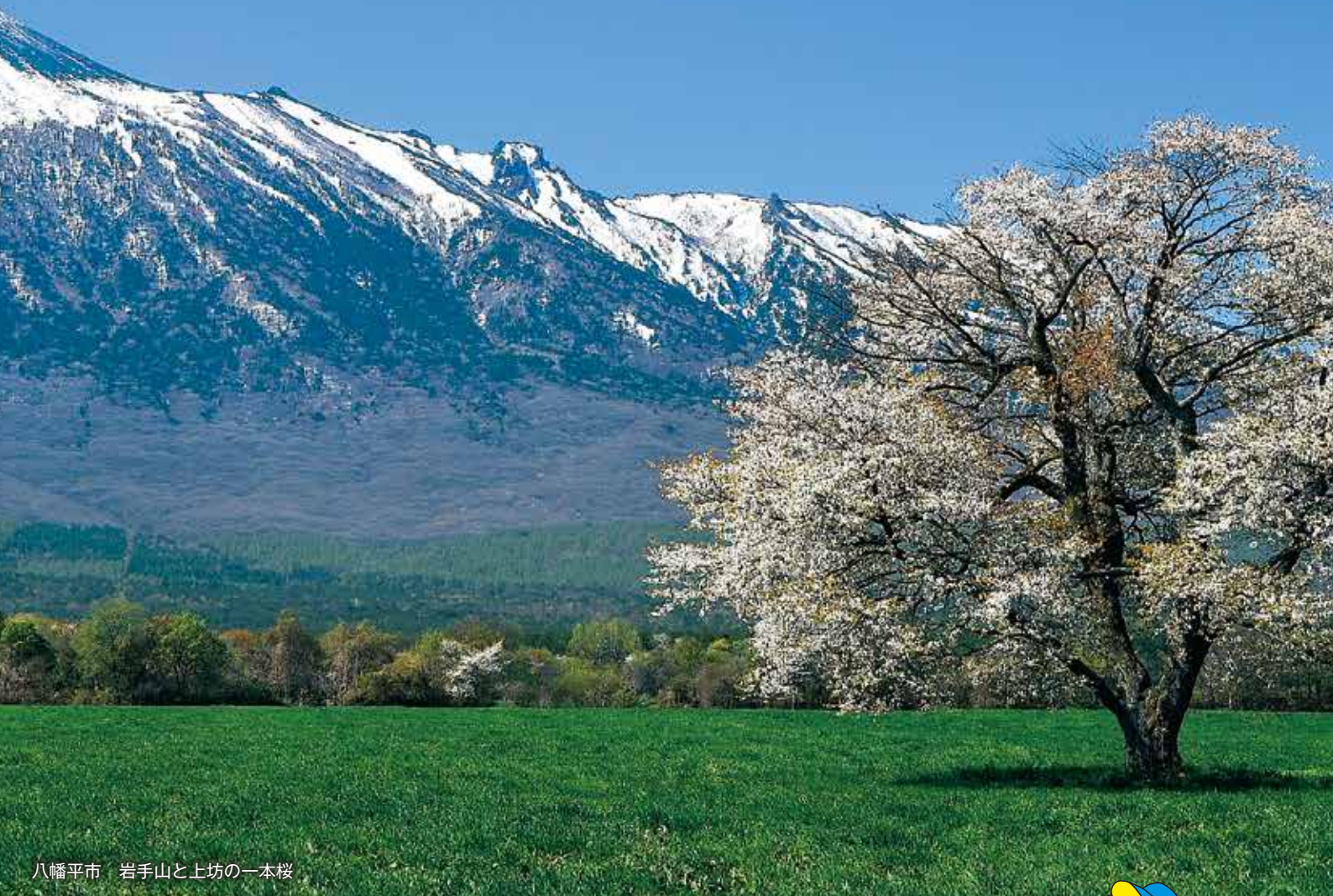
八幡平市 岩手山と上坊の一本桜