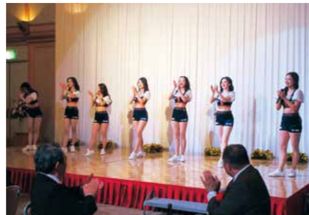
レッドチャーム演技