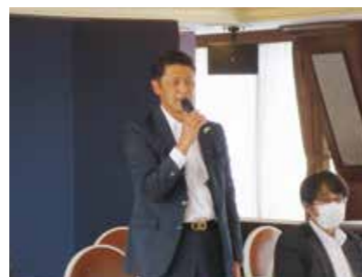
三和薬肥朝倉社長挨拶